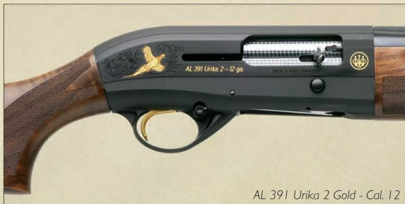
AL 391 Urika 2 Gold - Cal. 12