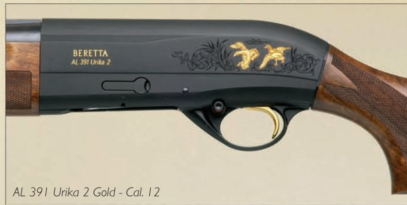
AL 391 Urika 2 Gold - Cal. 12

Via Pietro Beretta, 18 25063 Gardone Val Trompia Brescia, Italia Tel. (030) 8341-1 www.beretta.com