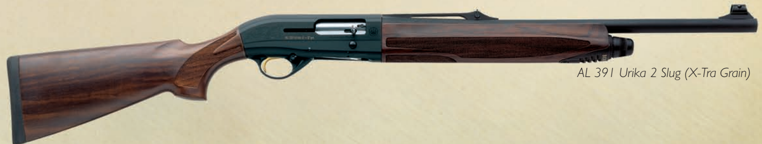
AL 391 Urika 2 Slug (X-Tra Grain)

Esclusiva finitura X-Tra Grain Beretta: il lusso accessibile.