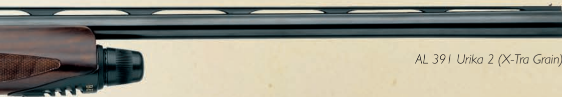
AL 391 Urika 2 (X-Tra Grain)