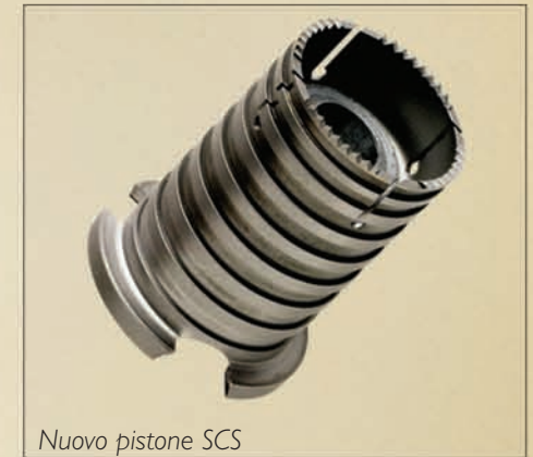
Nuovo pistone SCS

*** Innovativo processo senza applicazione di pellicola.