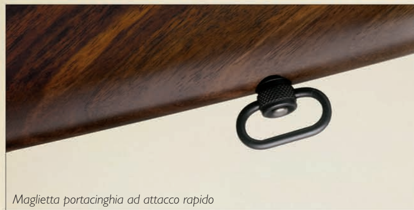
Maglietta portacinghia ad attacco rapido

Urika 2 Gold a scene caccia con animali in similoro. Soggetti esclusivi secondo il calibro. Entrambe le versioni sono disponibili anche con canna Slug, dotata di corta bindella a rampa con tacca di mira a V e mirino a lama con tunnel antiriflessi.